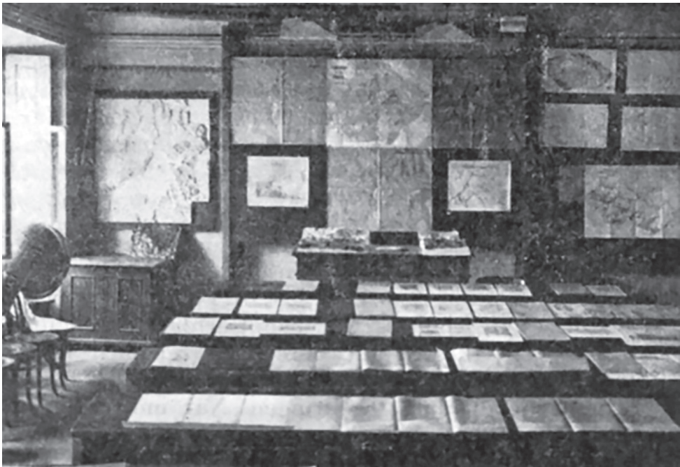
Posluchárna geografie, zdroj: Ludwig (1934).

Author's address: Historický ústav AV ČR, v. v. i. Prosecká 76 190 00 Praha 9