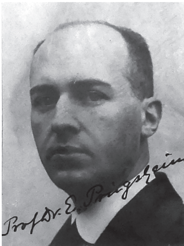
Obr. 1. Ernst Georg Pringsheim počátkem 20. let po příchodu na Německou univerzitu v Praze.